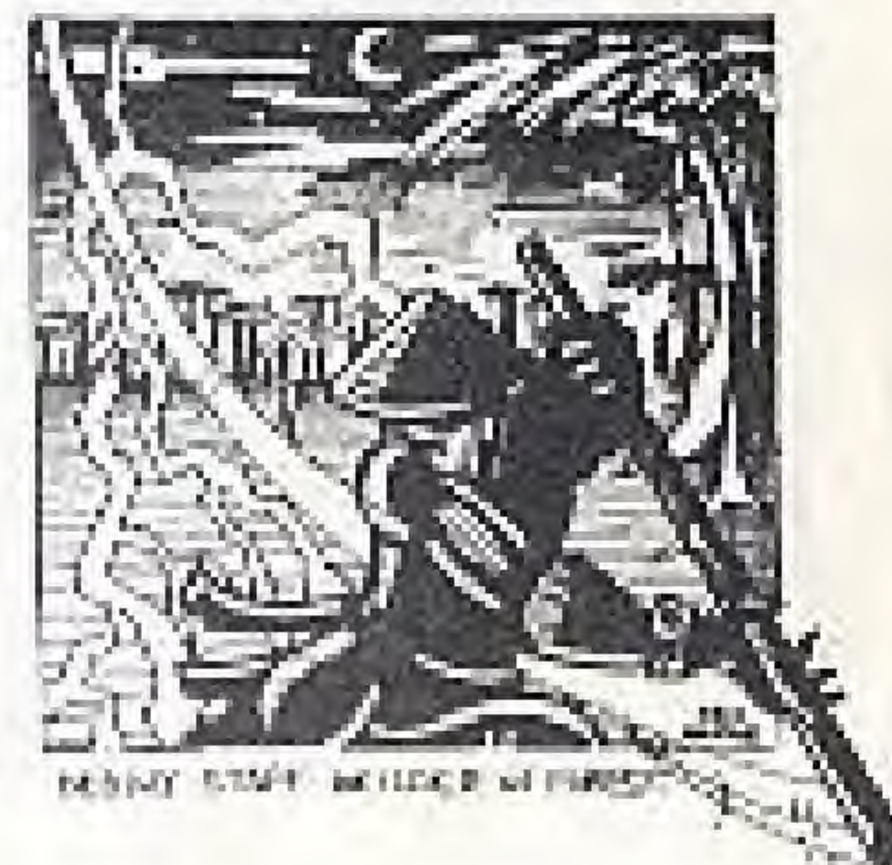
DEADLY STAFF WELTER IN FOREST